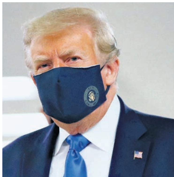
In this Saturday, July 11, 2020, file photo, President Donald Trump wears a face mask as he walks down a hallway during a visit to Walter Reed National Military Medical Center in Bethesda, Md.

When Uniqlo, a major Japanese clothing retailer, put its white "cool and dry" masks with breathable fabric on sale in June, shoppers lined up at stores and crashed its website. Supplies sold out in hours. □